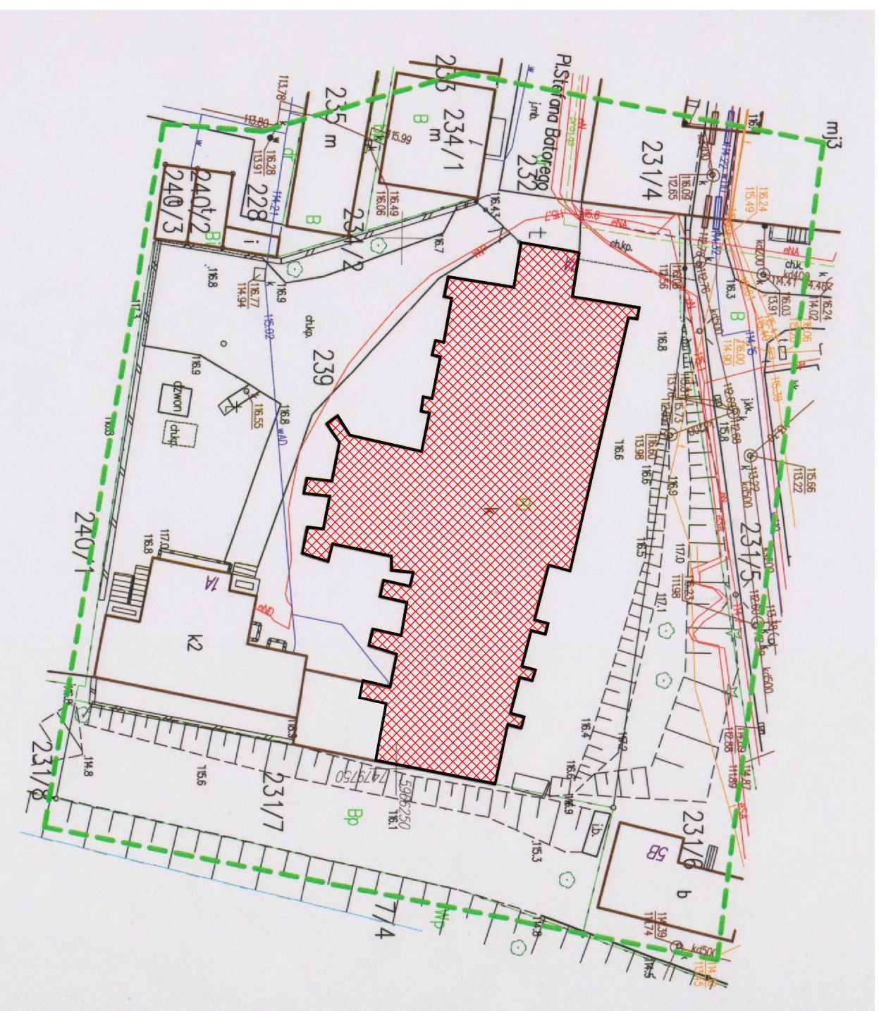
PLAN SYTUACYJNY 1:500